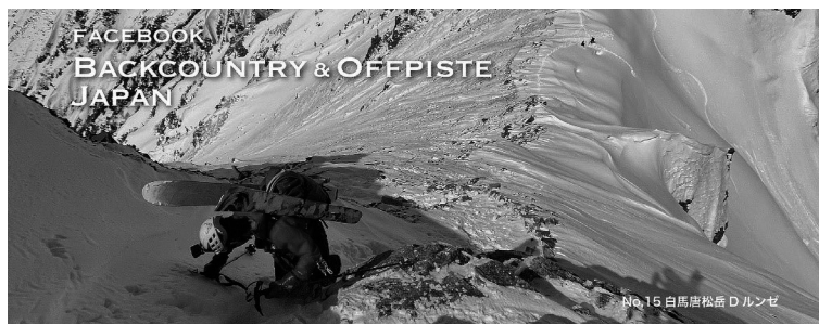
(図表3) Facebookのグループ機能を使った集まりの1つ③ ～ バックカントリースキー&スノーボード ～