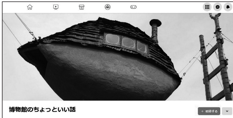
(図表2) Facebookのグループ機能を使った集まりの1つ② ～ 博物館のちょっといい話 ～