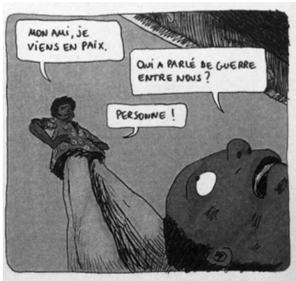
図3 Marguerite Aboutet, clément Oubrerie: Aya de Yopougon , 2, Bayou, p.79