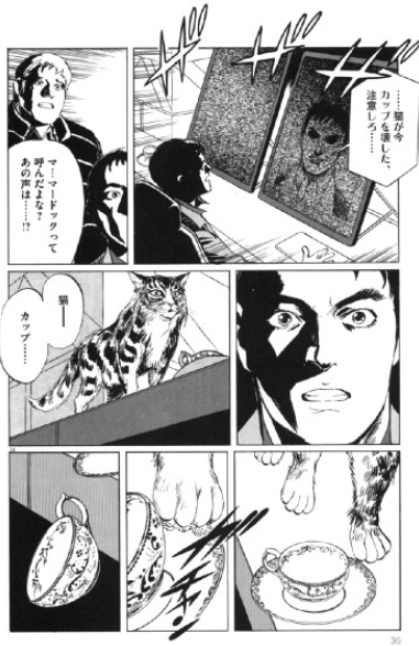
図1 星野之宣『未来からのホットライン』小学館 p.36

ところで、出原氏のいう身体離脱ショットとはどのようなものなのだろうか？図2を見られたい。