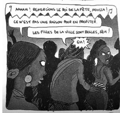
図4 同書, 1, p.90