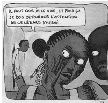
図5 同書, 1, p.37

感が感じられないからだろうか? 作中世界外の描き手とはまた別に、出来事のまさに現場に匿名的な観察主体がいるのかもしれない。