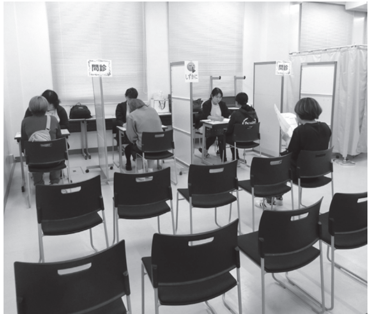
表4 検査・問診のまとめ