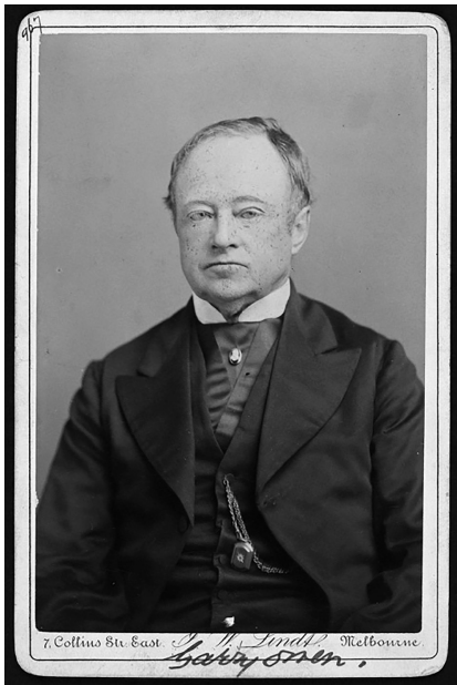
写真 Edmund Finn (La Trobe Picture Collection, State Library of Victoria, H3494)

『草創期メルボルンの年代記(1835-1852)』はギャリーオーウェン(Garryowen)のペンネームで知られるエドモンド・フィン(Edmund Finn: 1819-1898)によって執筆され、1888年に出版された。フィンは、1819年、アイルランドのティペラリーの裕福な家庭に生まれ、カトリックの司祭になるための教育を受けた 10) 。しかし、彼は司祭にはならなかった。フィンは家族とともに、1841年7月にメルボルンに移住する。メルボルンのポート・フィリップに着いてから最初の4年間、彼が22歳から26歳の期間、何をしていたのか不明である。