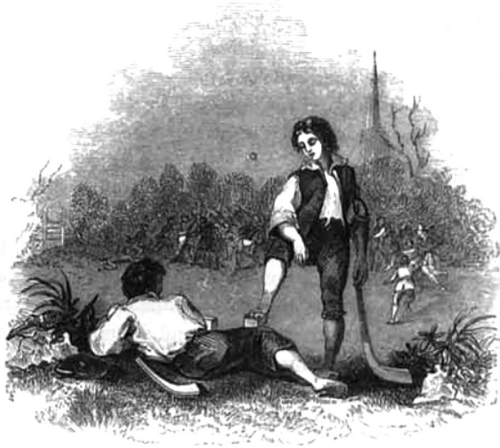
図1. アイルランド(ケリー)のハーリング(ハーレー) Hall, S. & C. Ireland: its scenery, character etc., Volumes . London: How & Parsons, 1841, p. 257.

として、鋭敏な視覚、手の器用さ、力強い腕のほか、走るのが速いこと、レスリングに熟練していること、意思が強いこと 22) を挙げている。ハーレーはクリケットによく似た点もあるが、ルールやバットの形状が完全に異なると指摘しており、バットの違いについては、クリケットのバットが直線であるのに対して、ハーレーのバットは曲がっていることだ 23) (図1参照)と述べている。