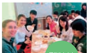
留学生たちとお食事会

国際料理パーティーの実施、留学生を交えたディスカッション会の開催、日本の企業や文化財への見学など、異文化やお互いを楽しく知ることができるイベントを定期的に行っています。(イベントをきっかけに、留学生の、もしくは日本人の友達ができた、という参加者の声多数です!)