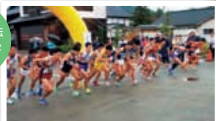
関西学生駅伝スタート直後

会にも注力しています。昨年度は10000mの記録の大学別平均上位12校のみが選出される記録審査を通過し、関西学生駅伝に2年ぶりに出場することができました。